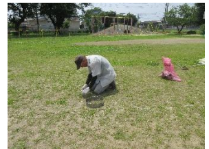
除草作業中の学校応援団の方

緑豊かな木々や草花に囲まれた本校は、市内で一番自然豊かな環境に恵まれています。一方でその反面、常に除草や樹木の剪定、落ち葉掃きなどの作業が不可欠でもあります。そのような中、今年度に入りより多くの地域の方々が学校応援団の活動として、除草を始め「花壇の整備」や「落ち葉掃き」などについてご尽力いただいております。