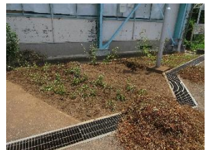
草むらからきれいな花壇に

特に東門の脇や体育館前、チャボ小屋の脇など、今まで雑草だらけであった土地をきれいな花壇に整備していただき、子供たちの目を楽しませてくれています。暑い中、また早朝からの整備や水撒き、落ち葉掃きなど、心より感謝申し上げます。また、このような学校応援団の活動について他にもご協力をいただける方がいらっしゃいましたら学校（教頭宛て）までご連絡をお待ちしております。☎ 281-0229