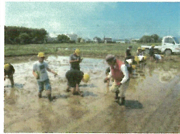
農家の方に教わり