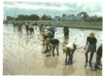
みんなで協力して