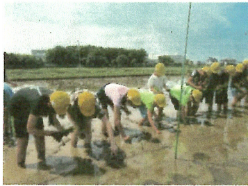
泥だらけになりながら